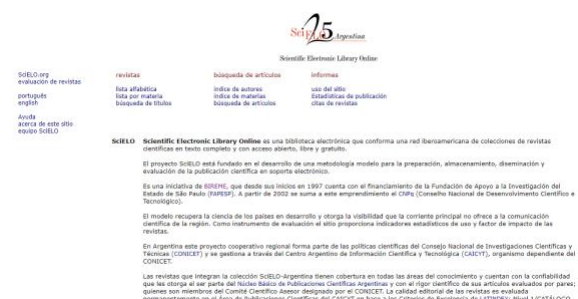
Anexo 6. Página de Scielo.

Sistematización documental de experiencias de rescate, diseminación y divulgación de la medicina tradicional y complementaria en Chile