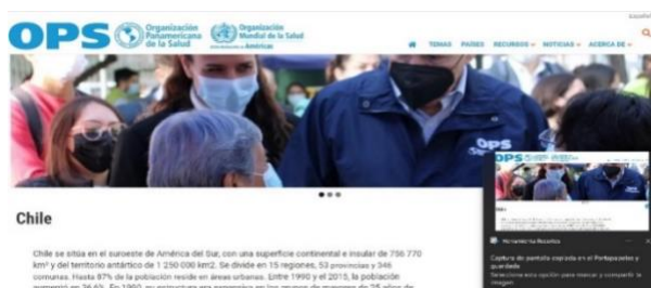
Anexo 4. Página de OPS.