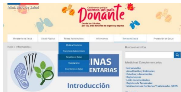
Anexo 2. Página de Ministerio de Salud de Chile