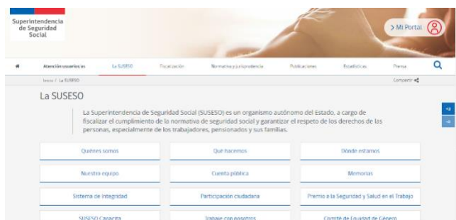
Anexo 5. Página de SUSESO.