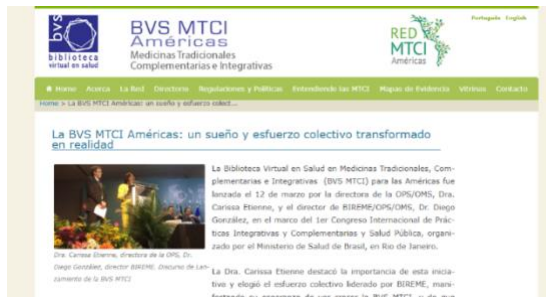
Pág. Biblioteca Virtual de salud