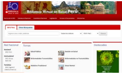
Página de la BVS Perú