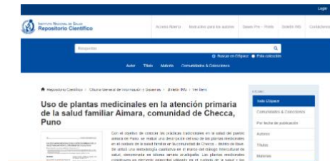
Repositorio Nacional de plantas