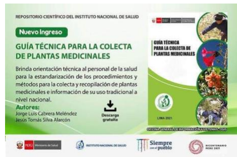
Guía para la recolecta de plantas medicinales.