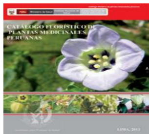
Catálogo de plantas medicinales.